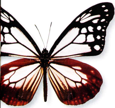
アサギマダラの雄(標本はぐんま昆虫の森蔵)