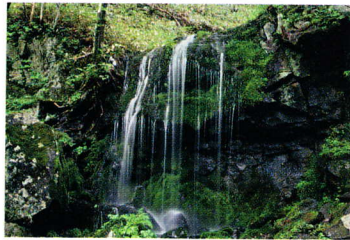
右/アサギマダラが集まる棧敷山の中腹。登山口より徒歩約10分 左/棧敷山の麓から車で10分程の場所にある「たまだれの滝」